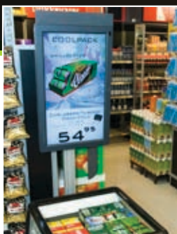
Mobil promotion stander fra Carlsberg